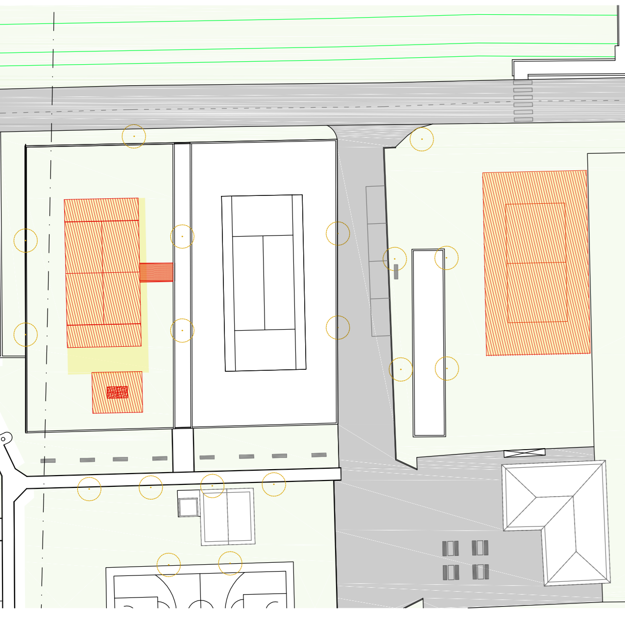
Planimetria e demolizioni e costruzioni (Area Sportiva) 1:500